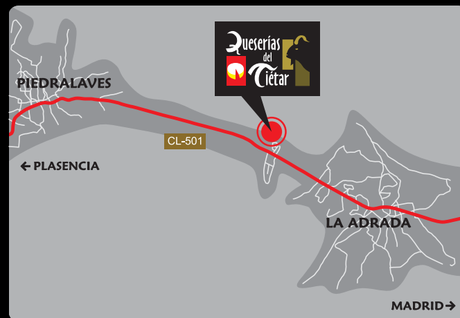
La Adrada (Ávila)