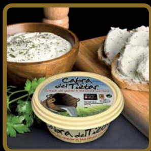
Cabra del Tiétar® a las finas hierbas