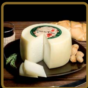
Cabra del Tiétar® semicurado