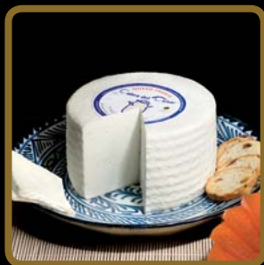
Cabra del Tiétar® fresco